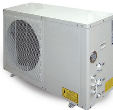
Produit avec garantie standard 2 ans pièces.

Réversible, elle peut réchauffer votre piscine ou encore la rafraîchir lorsque l'eau devient trop chaude.